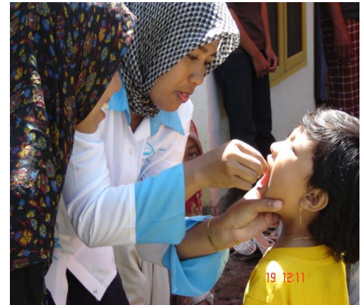
Achenese Women and Tsunami