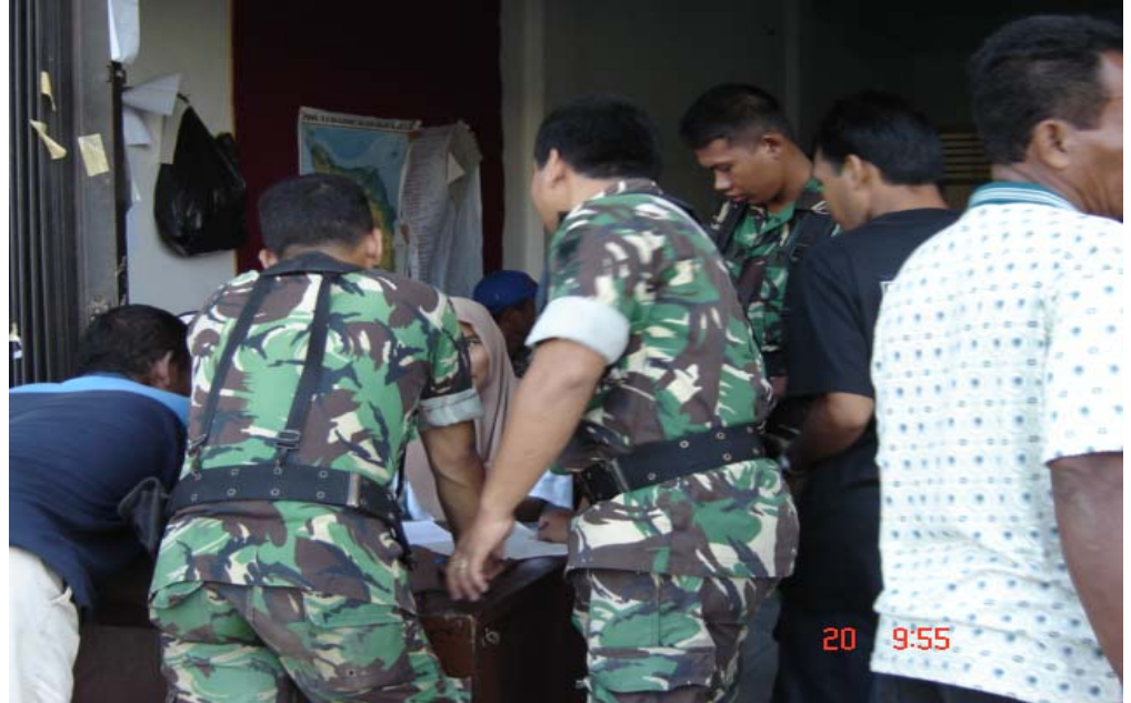
Sejumlah TNI sedang meminta bantuan dari salah satu posko organisasi aktivis

Masih belum selesai lagi daftar kejahatan kemanusiaan mulai dari masa Daerah