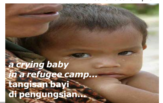
a crying baby in a refugee camp... tangisan bayi di pengungsian...