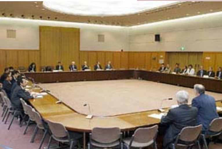
Perundingan di Tokyo yang di fasilitasi kuartet Amerika, Jepang, Uni Eropa dan Bank Dunia. Kalah dengan kelompok garis keras Indonesia