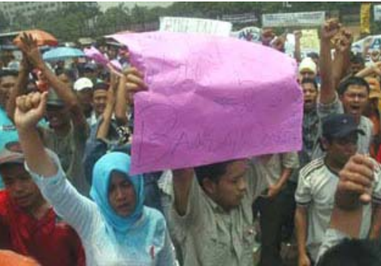
Demo meminta pembentukan "propinsi" Aceh Leuser Antara, di Jakarta September lalu. Terjebak Skenario Indonesia